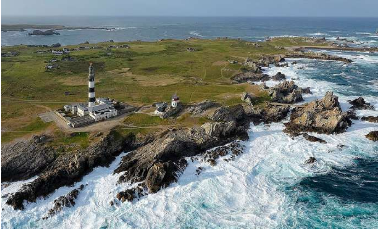
Ouessant par beau temps

De notre aérodrome de départ à Guiscriff (LFES), nous survolerons le littoral nord breton: la côte dorée puis la côte des légendes, en poussant un peu, les plus téméraires se poseront à Ouessant, l'extrême ouest de l'Europe.