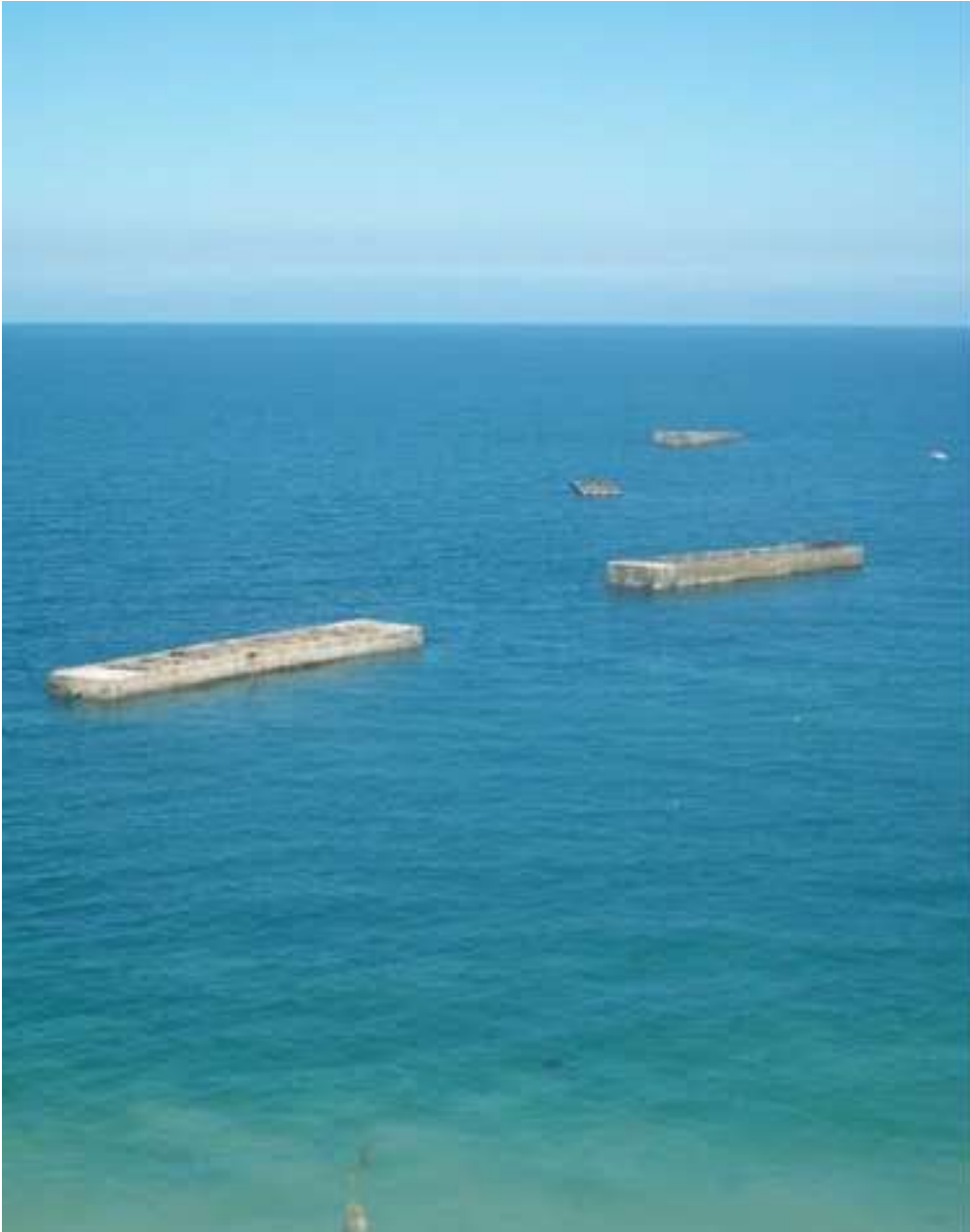
Caissons Phenix, Arromanches

L'après midi, desination Lessay, grande navigation sur les plages du débarquement, passage au dessus de Sainte Mère l'église.