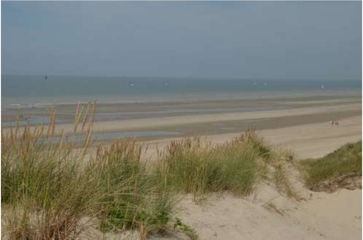
Grande plage du Nord

Arrivée au pays Ch'ti, nous longeons la frontière belge de Douzy à Dunkerque où nous ferons une pause déjeuner; c'est ici que commencera notre long survol côtier des grandes plages de la Manche ; successivement : la côte d'opale, la côte d'albatre, la côte fleurie et la côte de nacre: émotion garantie jusqu'à notre arrivée à Guisriff. Nuit à Berck