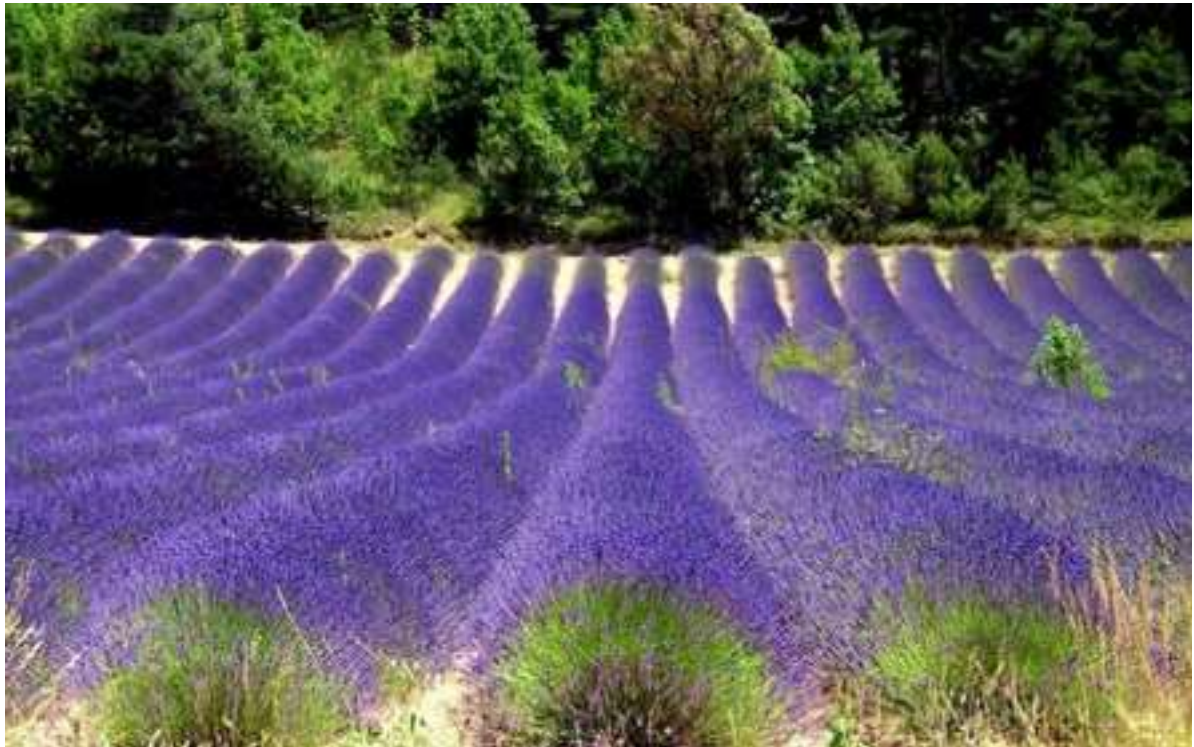
Couleurs de Provence