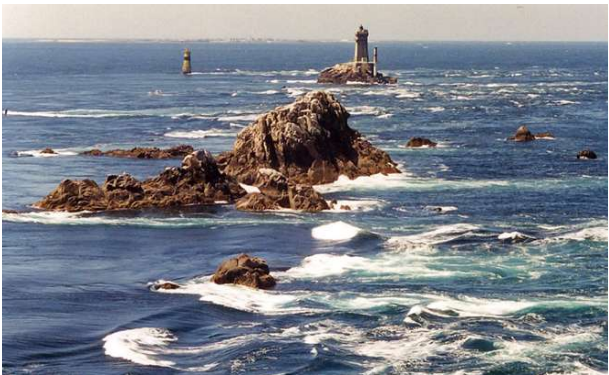
Pointe du Raz

Après une nuit au parfum océanique de Guiscriff, nous iront découvrir le littoral sud breton : la côte d'Iroise et la côte de Cornouaille : la légendaire pointe du raz puis la plage de la Torche longue de 25 km, le pays bigouden, Bénodet au fond de l'estuaire de l'Odet.