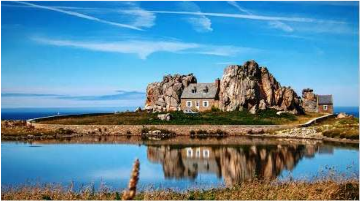
Côte de granit rose

Le soir retour à notre aérodrome de départ pour notre grande soirée de clôture.