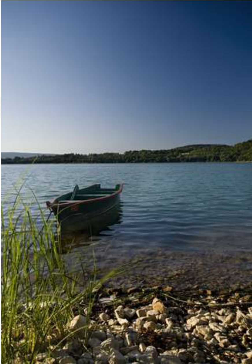
Lac de Vouglans

Nous avons fait plus de la moitié de notre voyage et quittons la moitié sud de la France pour traverser le jura: nous apprécierons son petit relief, ses couleurs, ses lacs et ses forêts; l'après midi, nous nous rendrons en Alsace à Haguenau, fief de « Finess max » importateur des fameux pipistrel et radio/transpondeur Filser/ Funkwerk