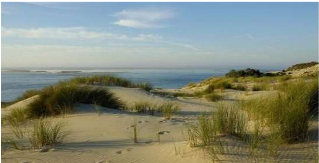
Dune du Pilat

Pas de repos pour l'instant, nous continuons notre descente du littoral : les côtes sauvages, la côte de Beauté et la côte d'argent avant de rejoindre les contreforts des Pyrénées jusqu'à Oloron : les vignobles Bordelais, la dune du Pilat, les pinèdes Basques à perte de vue qui contrasteront avec le relief pyrénéen.